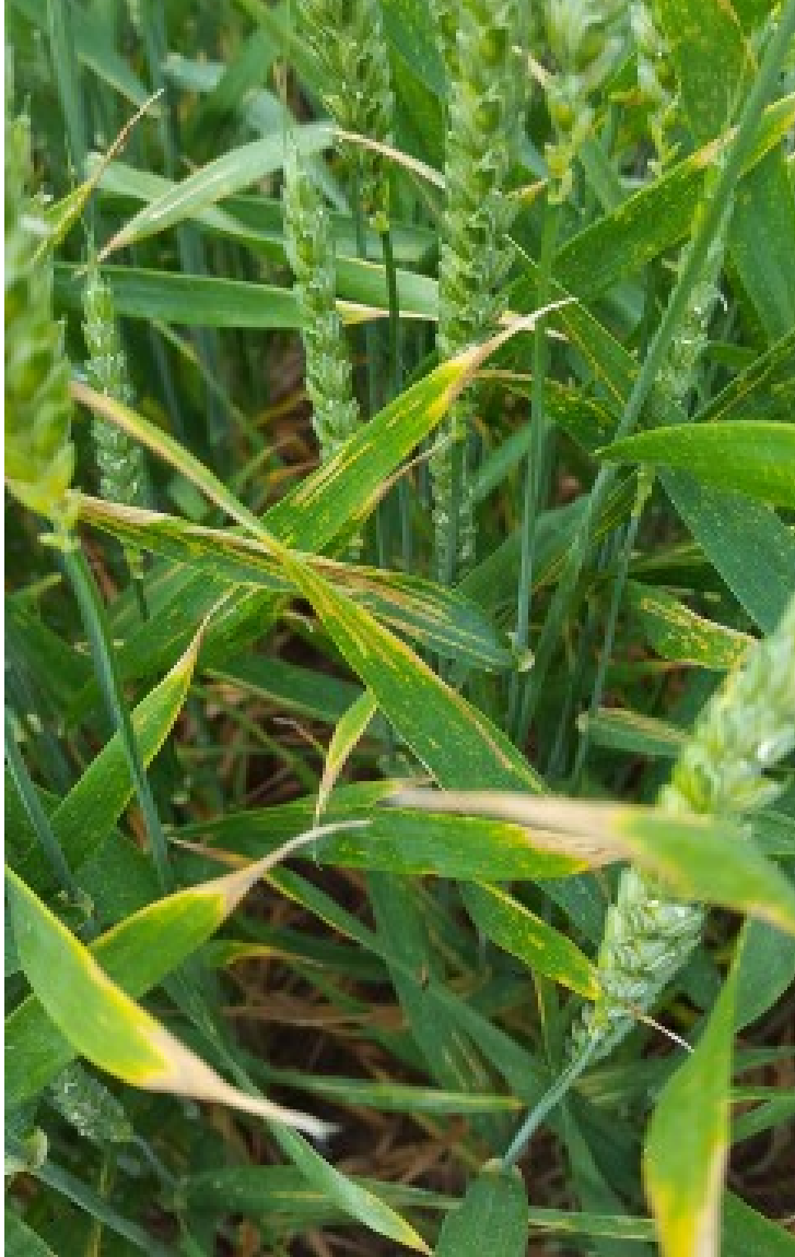
Billede 1. Gulrust i ubehandlet Kalmar hvede i et landsforsøg ved Odder fotograferet 22. juni af Gitte Skovgaard Jensen, LMO.